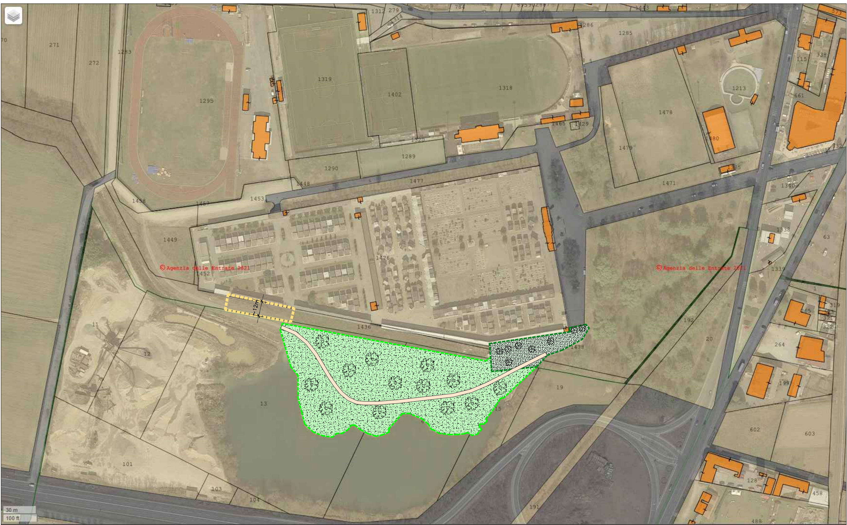
sovrapposizione estratto di mappa - immagine aerea

QUESTO DISEGNO E' DI PROPRIETA' DI "ARCHINGEO STUDIO ASSOCIATO": NON DEVE ESSERE COPRATO O RIVOLGATO SENZA AUTORIZZAZIONE SCRITTA. This drawing is Archingeo's property, it must not be copied and/or published without written authorization.