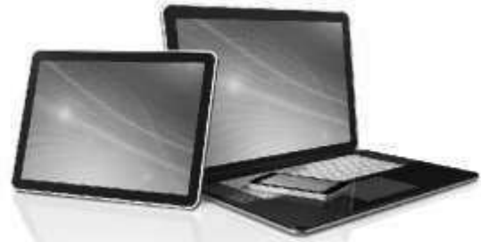
E' responsive. Si puo' operare su pc, tablet e smartphone

NUVOLAComuni comprende software e servizio cloud.